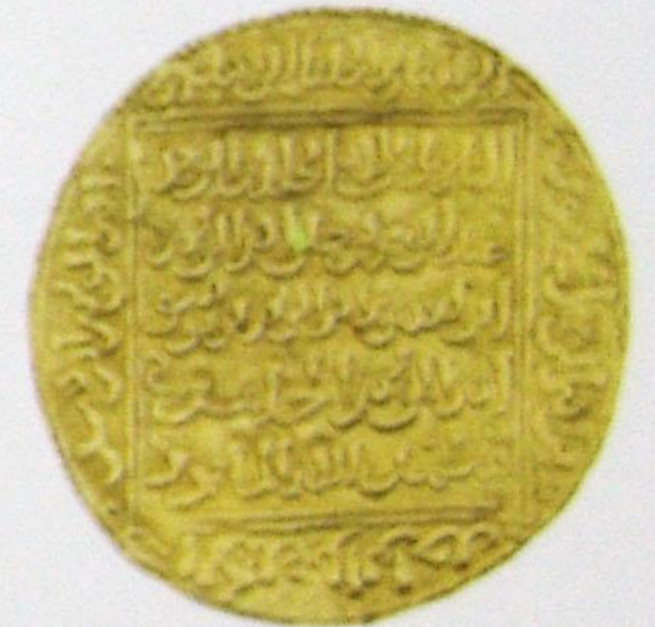
دينار موهبي أبو الحسن علي السعيد ضربت سبها Mowahbi Dinar Abu Al-Hasan Ali Al-Sa'eed struck at Siba